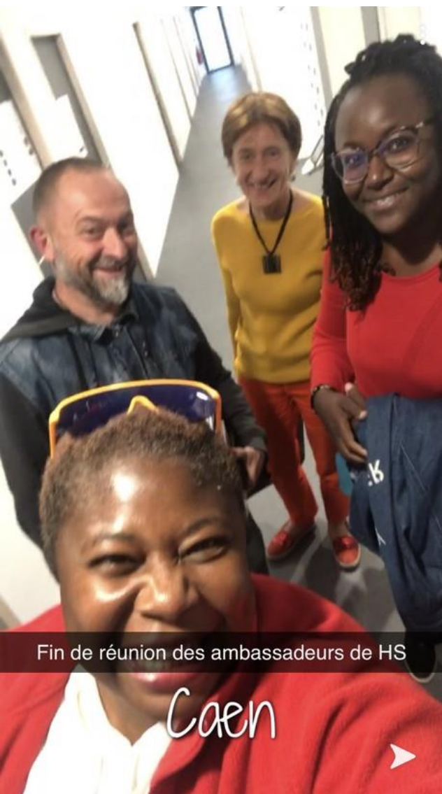
Fin de réunion des ambassadeurs de HS