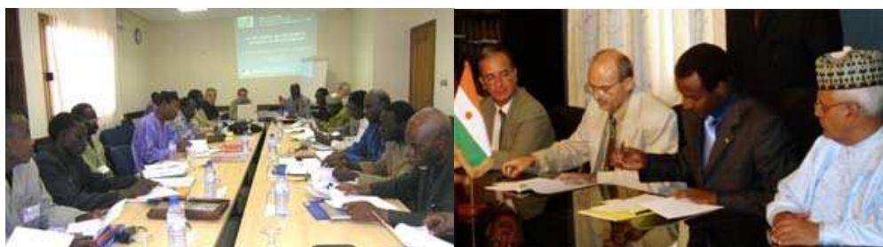
appui à la décentralisation : formation en appui au processus de décentralisation; signature, par l'AFD, d'une convention pour le renforcement des capacités de la Communauté Urbaine de Niamey en matière de Développement Urbain