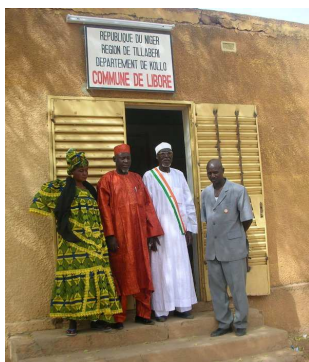
Mairie de Liboré

Les acteurs de coopération internationale doivent s'inscrire dans cette logique de renforcement des capacités de l'espace local si l'on veut des actions viables et durables