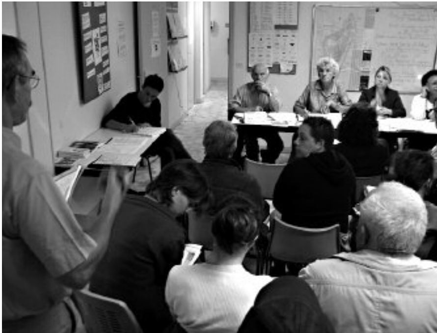
Réunion de la plate-forme Madagascar.

Depuis la création de la plate-forme Sénégal en mai 2005, cinq autres groupes ont vu le jour. Réunissant tous les acteurs régionaux de la coopération décentralisée et de la solidarité internationale œuvrant sur un même pays, elles sont l'expression concrète de la notion de réseau à l'origine d'Horizons Solidaires.