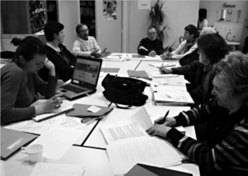
Réunion de la plate-forme Niger.

sources, etc. La participation de chacun est sollicitée pour constituer cette base de données régionales. Six plates-formes pays existent déjà : après le Sénégal, se sont constitués les groupes Burkina-Faso, Mali, Madagascar, Asie du Sud-Est et dernièrement Niger. Une plate-forme Amérique Latine est en projet. Le nombre de participants varient selon les groupes, Burkina, Sénégal et Mali constituant les plus gros contingents. Les plates-formes travaillent sur des thématiques choisies par l'ensemble des membres. Des personnes ressources sont sollicitées pour apporter leurs compétences lors des réunions ou de la rédaction de la lettre. « Le rôle de l'animateur consiste, en partant du souhait des membres, à rechercher des informations, nourrir la réflexion et favoriser les échanges », explique Claire Guyon, chargée de mission à l'AFDI. L'association co-anime avec Horizons Solidaires la plate-forme Mali.