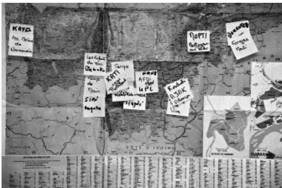
La plate-forme recense les acteurs intervenant dans les pays, comme ici au Mali.