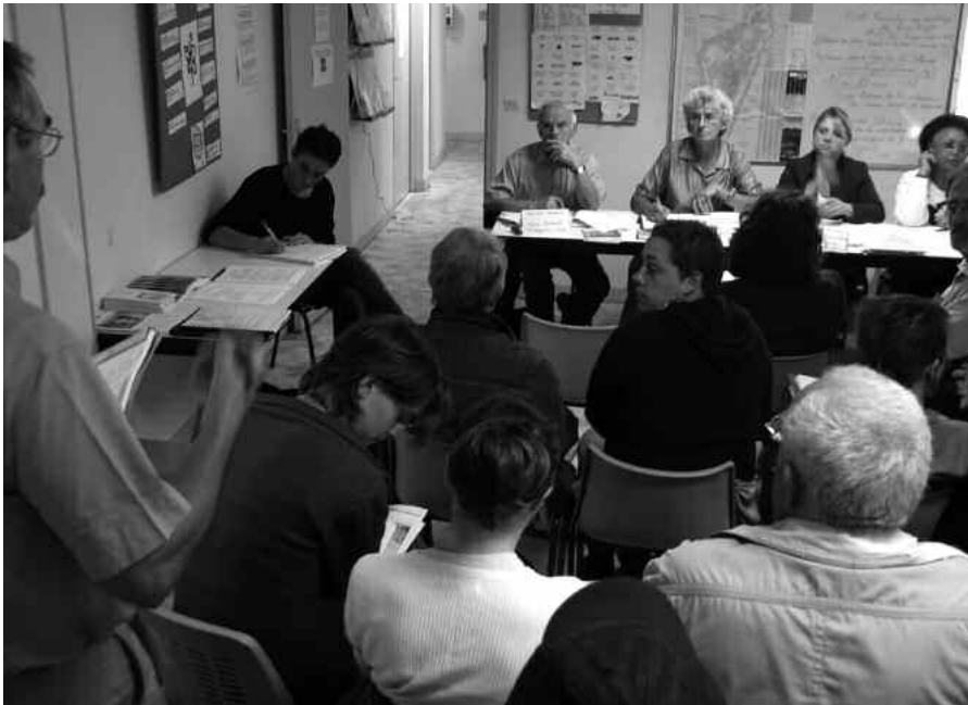
Réunion de la plate-forme Madagascar, septembre 2006.

Les plates-formes géographiques régionales d'Horizons Solidaires permettent de réunir, deux à trois fois par an, tous les acteurs bas-normands de la coopération décentralisée et de la solidarité internationale qui mènent des actions d'appui dans un pays donné, en voie de développement. Les membres des plates-formes se retrouveront à la rentrée pour faire le point sur leurs activités et rapporter des nouvelles « fraîches » de leurs récents voyages dans ces pays. Si vous avez des actions ou un intérêt pour l'un de ces pays, n'hésitez pas à les rejoindre.