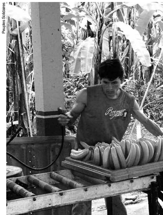
En Equateur, premier exportateur mondial de bananes, la législation du travail n'a jamais été très protectrice des travailleurs agricoles.